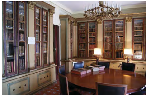
Biblioteca do Consulado

A Biblioteca do Consulado é unha institución cultural de carácter ilustrado. Pertence á Fundación cultural privada máis antiga de España, inscrita o 31 de xaneiro de 1807 no Protectorado de Fundacións Culturais. Foi a primeira biblioteca pública en establecerse na cidade da Coruña baixo o amparo do Real Consulado de Mar e Terra en 1803 e aberta ao público en 1806. Conta con volumes chegados de importantes coleccións como a de José Cornide ou Xoana de Vega. Entre as súas obras a destacar atópanse un incunable de 1498 ou un manuscrito de Quevedo.