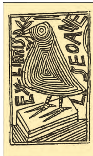
Ex libris de Luís Seoane