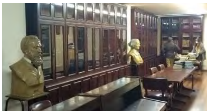
Biblioteca do Circo de Artesáns