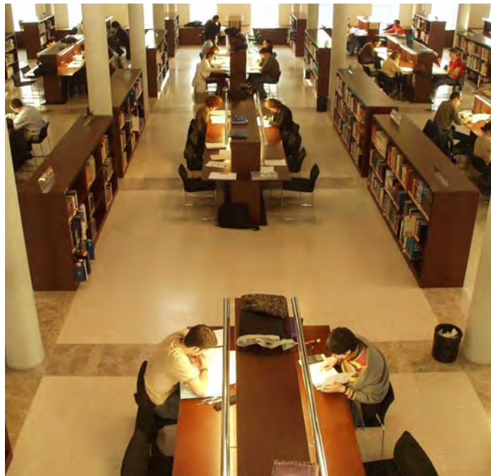
Biblioteca González Garcés