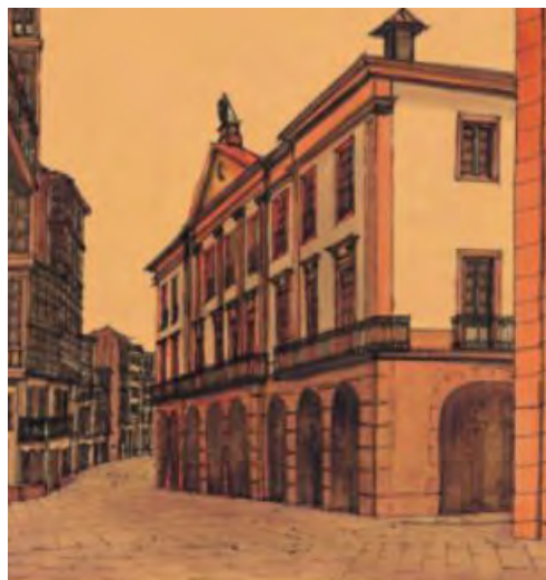
O conxunto do Teatro Rosalía de Castro-Biblioteca da Deputación da Coruña