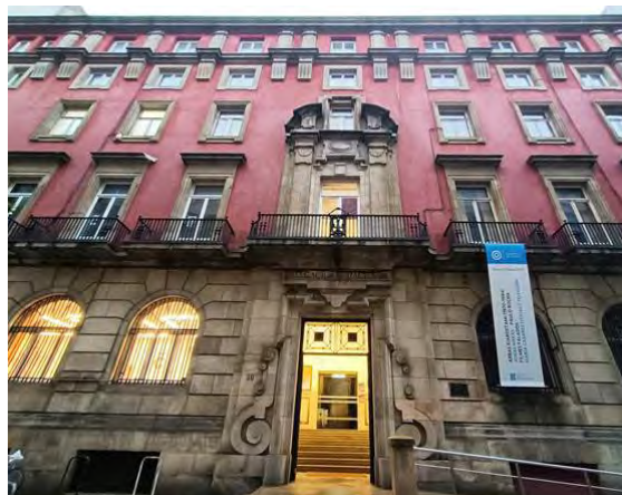
Biblioteca de Estudos Locais

A rede de bibliotecas municipais da Coruña conta con distintos espazos espallados por todos os barrios da cidade. A Biblioteca de Estudos Locais é herdeira das primeiras iniciativas do consistorio para universalizar o acceso á lectura. A biblioteca que estivera ubicada nun primeiro momento na casa do concello en María Pita pasa, xunto co Arquivo Municipal, ás dependencias de Durán Loriga na década dos setenta. Coa chegada do novo milenio esta rede municipal vaise multiplicando chegando a moitos barrios da cidade e nesta sede inicial están dúas bibliotecas, unha delas a Biblioteca de Estudos Locais que hoxe en día se ocupa de atesourar volumes impresos que teñan relación con temática herculina.